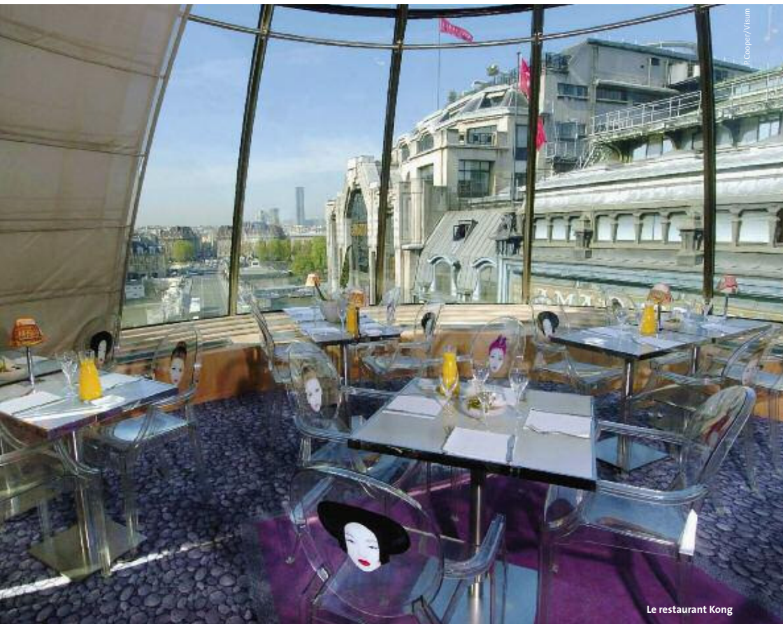
Le restaurant Kong