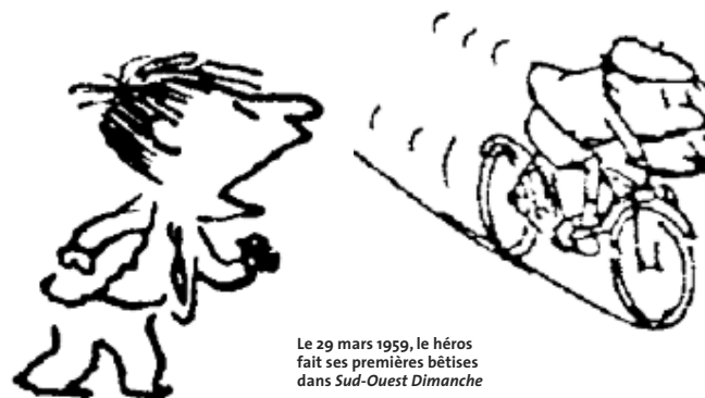
Le 29 mars 1959, le héros fait ses premières bêtises dans Sud-Ouest Dimanche

y a Alceste, le petit gros qui mange tout le temps ; Geoffroy, l'enfant pourri gâté ; Agnan, le chouchou de la maîtresse ; Eudes, le costaud de la bande et bien d'autres. On se castagne dans la cour de récré , on invente des jeux sur le terrain vague , on fait les quatre cents coups . Les adultes ont du mal à contrôler ces garnements . Le surveillant , le Bouillon, la maîtresse , les parents de Nicolas sont souvent dépas-