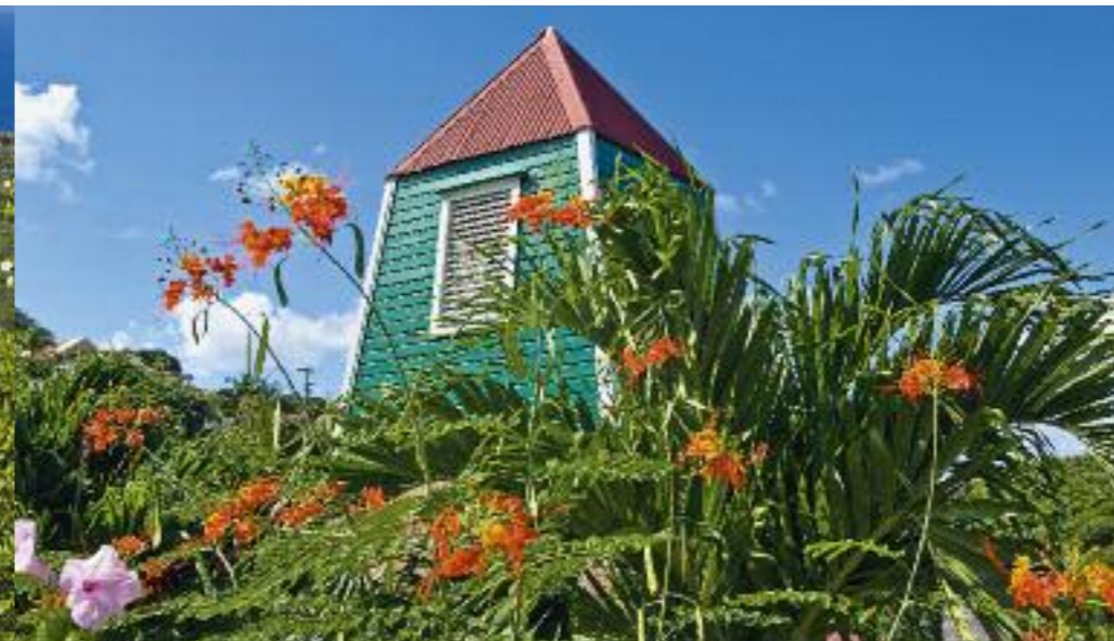
Le clocher suédois de Gustavia, construit vers 1790