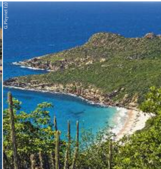
Vue sur la plage de Grande Saline