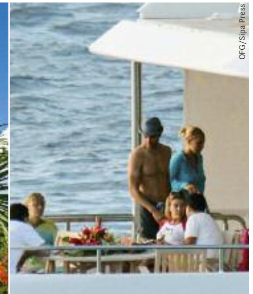
Enrique Iglesias et Anna Kournikova