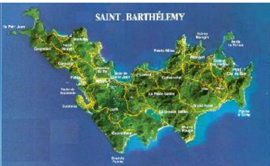
Saint-Barthélemy, 21 km 2 , dans le nord-est de la mer des Caraïbes