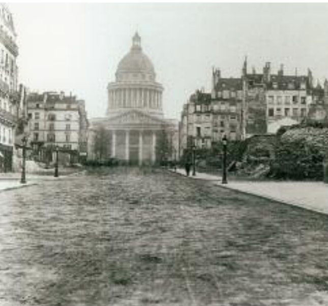
La rue Soufflot en travaux, 1876