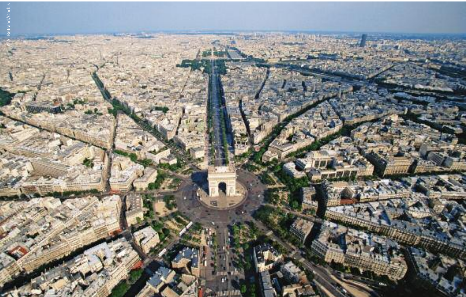
La place Charles-de-Gaulle, appelée aussi place de l'Étoile