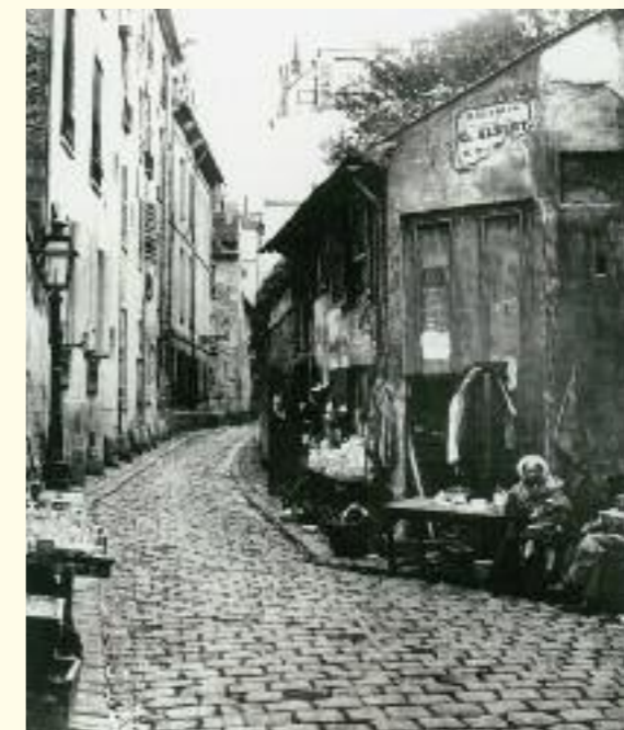
La rue du Jardinnet, 1865

Les taudis laissent la place à des immeubles bourgeois. Près de 120 000 logements insalubres sont remplacés par 320 000 appartements neufs. Les nouveaux immeubles doublent de hauteur , passant en général à cinq ou six étages. Les prix de l'immobilier grimpe , chassant les classes les plus défavorisées . Mais qu'importe .