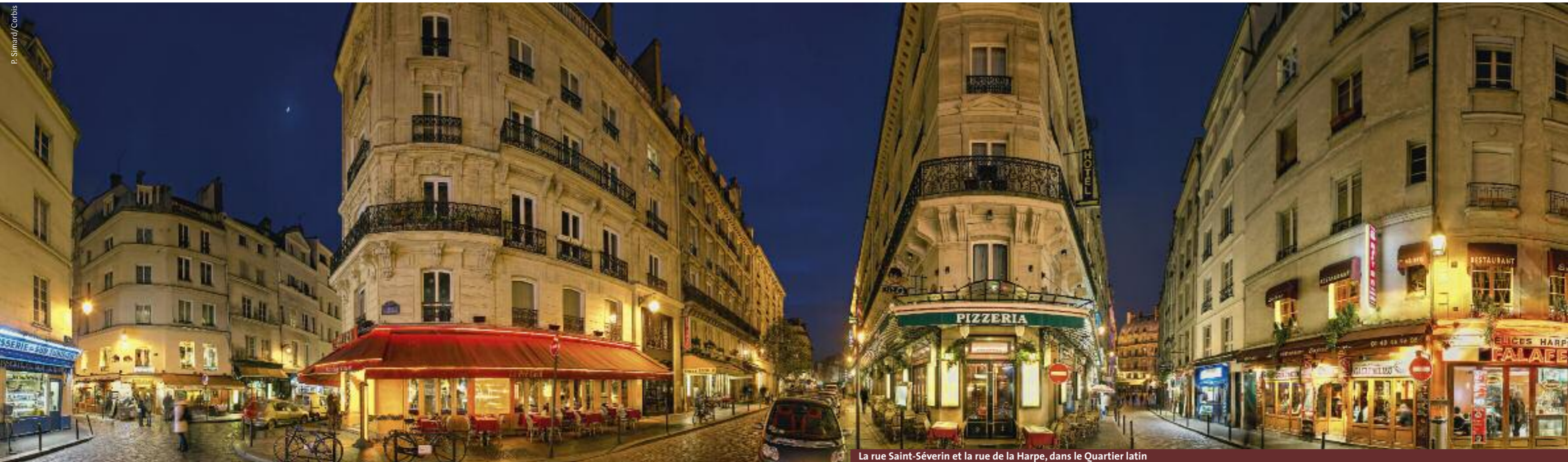
La rue Saint-Séverin et la rue de la Harpe, dans le Quartier latin