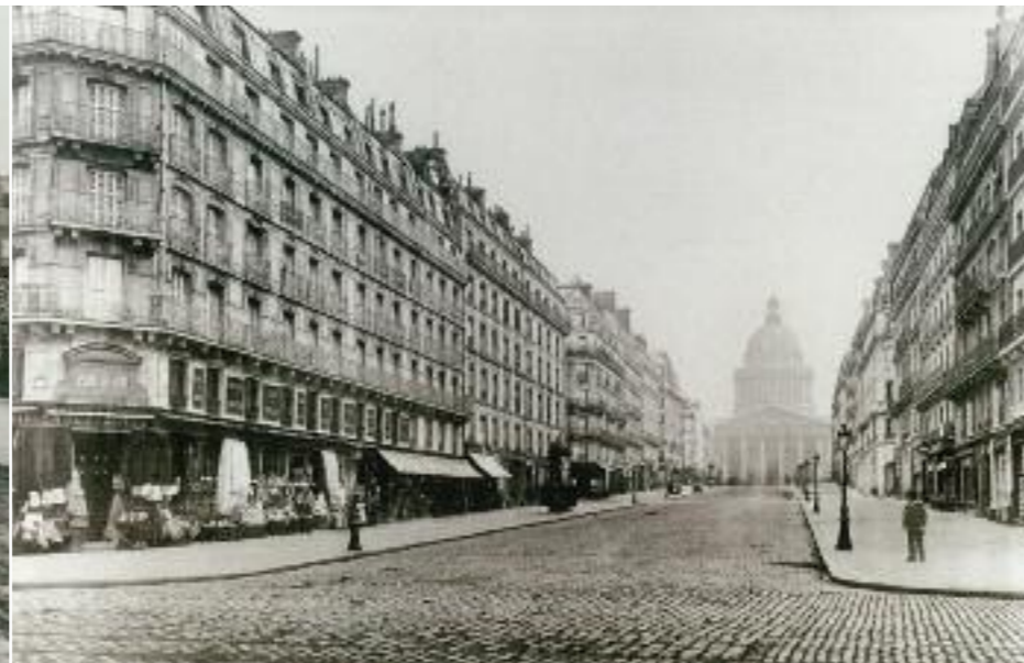
La rue Soufflot achevée, 1877