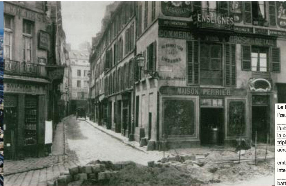
La rue du Maître-Albert, 1866