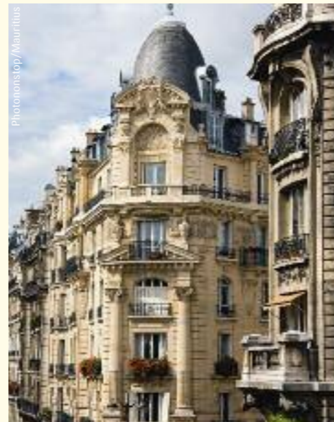
Dans le quartier de la gare de Lyon

Dès 1853, les travaux commencent. Napoléon III veut de grandes artères. Avant lui, Louis XIV et Louis-Philippe en avaient déjà tracé quelques-unes. Haussmann, lui, crée 70 axes dont certains peuvent atteindre 30 mètres de large ! Les boulevards Magenta et Malesherbes, les avenues Kléber et Foch, la rue de Rivoli voient le jour . Ces grands axes facilitent la circulation, aèrent la ville et... permettent à la police et à l'artillerie de pénétrer dans les vieux quartiers, foyers révolutionnaires craints par Napoléon III. Ainsi, les boulevards Saint-Michel et Saint-Germain divisent le Quartier latin en quatre.